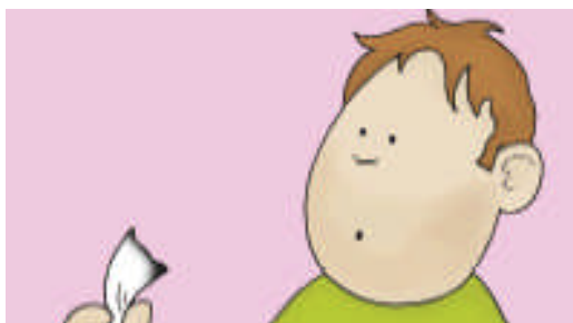
Rozrzuconych spalonych kawałków papieru.