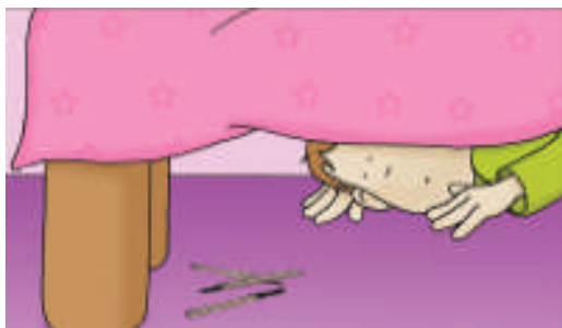
Rozrzuconych spalonych zapalek